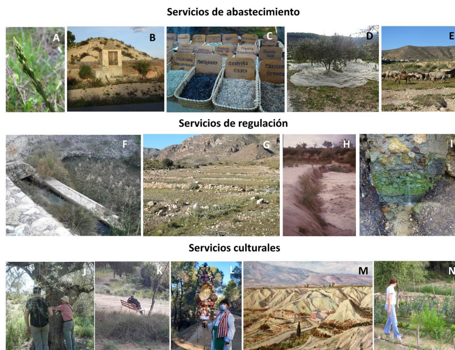
Figura 3. Algunos ejemplos de beneficios coproducidos en el socioecosistema de los ríos secos. A. Alimentos; B. Agua; C. Medicinas naturales; D. Cultivos de secano; E. Ganadería trashumante; F. regulación hídrica; G. Control de la erosión; H. Minimización de las avenidas de agua; I. Recarga del subálveo; J. Sentido de pertenencia; K. Relajación; L. Identidad cultural; M. Inspiración; N. Ocio y recreo. Some examples of benefits co-produced in the dry river socio-ecosystem. A. Food; B. Water; C. Natural medicines; D. Rainfed crops; E. Transhumant livestock; F. Water regulation; G. Erosion control; H. Minimisation of water floods; I. Recharge of sub-alveo; J. Sense of belonging; K. Relaxation; L. Cultural identity; M. Inspiration; N. Leisure and recreation.

en la Región de Murcia, a través de la interpretación de las fotos georreferenciadas de la plataforma Flickr. De las 652 fotografías recopiladas, tan solo una mostraba un río seco como objeto central de la fotografía (Vidal-Llamas et al. , 2024). Pero, es más, cuando preguntamos a las personas sobre sus preferencias paisajísticas de la Región de Murcia (Vidal-Llamas et al. , 2021) solo 3 personas de las 220 entrevistadas eligieron a los ríos secos como su paisaje preferido. Además, tan solo 7 lo seleccionaron como el paisaje menos preferido. Como primera conclusión parece que los ríos secos, no solo son despreciados, sino que son prácticamente “invisibles” para la población.